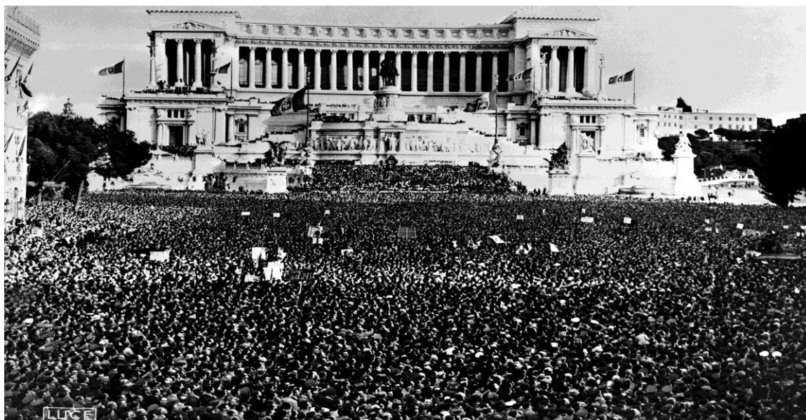
Piazza Venezia, Proclamazione dell'entrata dell'Italia nella seconda Guerra Mondiale, 10 giugno 1940

Il culto fascista della romanità : consenso e rimozioni