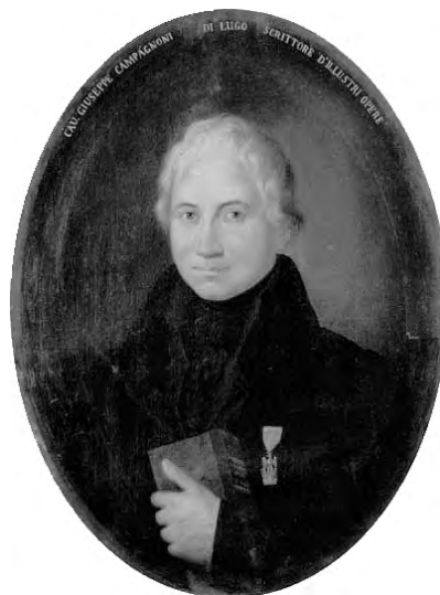
3. Giuseppe Compagnoni (1754-1833).