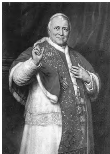
5. Pio IX (1846-1878).