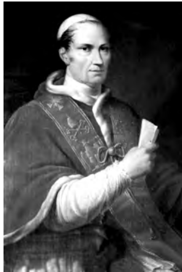
4. Leone XII (1823-1829).

24 Sugli studi giuridici a Roma durante la Re-