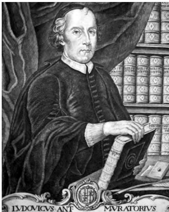
1. Ludovico Antonio Muratori (1672-1750).