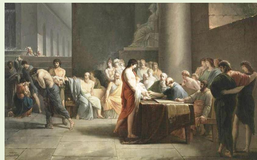
Jean-Pierre Saint-Ours – Le Choix des enfants de Sparte (1785-1786)

Dipartimento SAGAS, Via San Gallo 10 Aula Magna 9.00-18.00